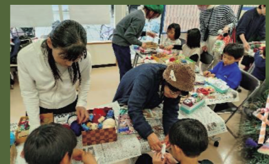
手作り大好き系コトの会