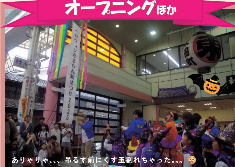
ありや、りや、... 吊るす前にくす玉割れちゃった。。。🥺