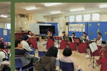
萩弦楽オーケストラ