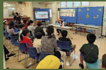
すまいる朗読倶楽部