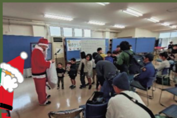
サンタさんの前には行列が!!

手作り大好き系コトの会さんのワークショップは、子どもだけでなく大人にも大人気♪ それぞれの自分だけの素敵なクリスマスオーナメントを作って、楽しい思い出と一緒にいいお土産になったようでした。