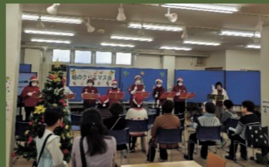
ほ☆すいベルクラブ

毎年恒例となりました『結のクリスマス会』を12月20日(土)11時より開催しました。 ほ☆すいベルクラブさんのハンドベル演奏で楽しいクリスマス会がスタート!!演奏が始まるとたくさんの方が集まり席はいっぱいになりました♪ すまいる朗読倶楽部さんの“クリスマスの絵本のよみきかせ”では子どもたちが一生懸命おはなしを聞いていました。“みんなで踊ろうクリスマスソング”では、ホワイトクリスマスの曲に合わせて楽しいダンスレッスン月そして、お昼前には待ちに待ったサンタさんの登場!!プレゼントをもらった子どもたちの笑顔と歓声があふれていました。 また、スタッフ手作りカレーも集まった皆さんに食べていただくことができ、“おいしかったー月”“みんなで食べるとおいしいね月”と嬉しい言葉をたくさんいただきました。 午後からのクリスマスコンサートは、ほ☆すいベルクラブ、二胡愛好会、そして今回初参加の萩弦楽オーケストラの皆さんによる生演奏。クリスマスソングや耳なじみのある曲を素敵な音色で奏てくださいました。そして、最後は午前中に練習した“ホワイトクリスマス”の曲に合わせてフラダンスを踊り、楽しいクリスマス会を終えることができました。アットホームな雰囲気の中で幸せなひと時が過ごせたのではないかと思います。